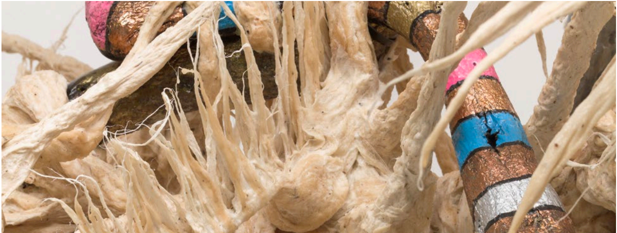
Guadalupe Maravilla, Pierna de serpiente , 2023 (detalle)

La alegría del fuego —la primera exposición individual de Guadalupe Maravilla en mor charpentier además de su primera presentación en Francia— ofrece un panorama completo sobre su práctica artística a través de los elementos que la hacen inconfundible. Su trabajo es transdisciplinar, y este es un aspecto que queda de manifiesto en la selección de obras, que mezclan pintura, escultura, video o performance, y una enorme diversidad de materiales. El espacio de exposición está bañado por el sonido de Mariposa Relámpago , un video de 30 minutos de duración que documenta el proceso material y espiritual de creación de su escultura monumental en el ICA Boston. Es la historia de cómo un antiguo autobús escolar estadounidense, localizado en El Salvador, fue transformado en un gigantesco instrumento de sanación.