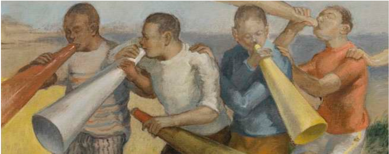
Chen Ching-Yuan, Propaganda III (detalle), 2022

Del 8 de octubre al 17 de diciembre, 2022